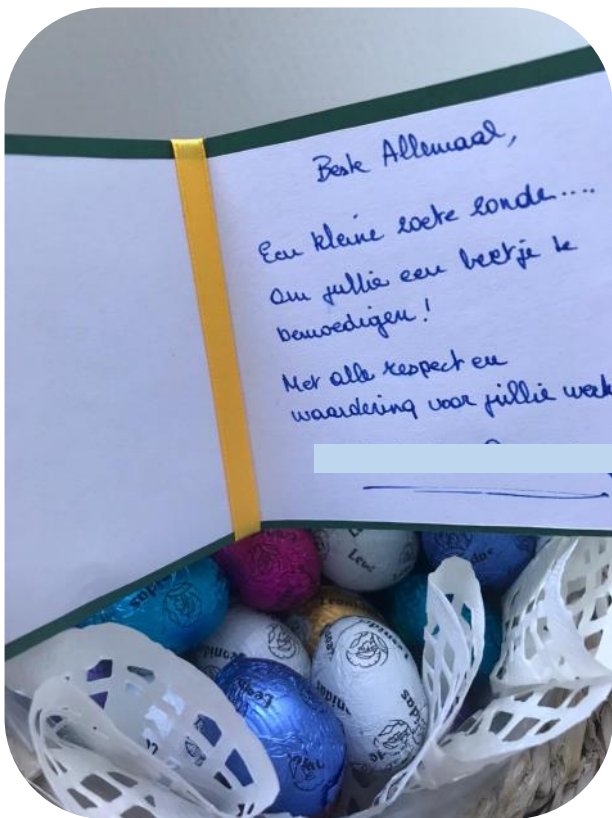
Paaseitjes als 'zoete zonde' en bemoediging.