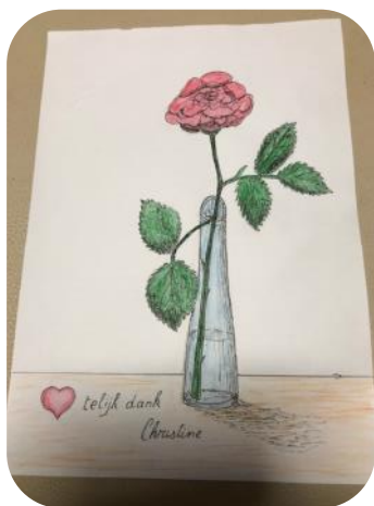
Tekening van een zorgvrager voor een verzorgende

Even pauze en volgende week hopelijk hetzelfde kunnen doen.